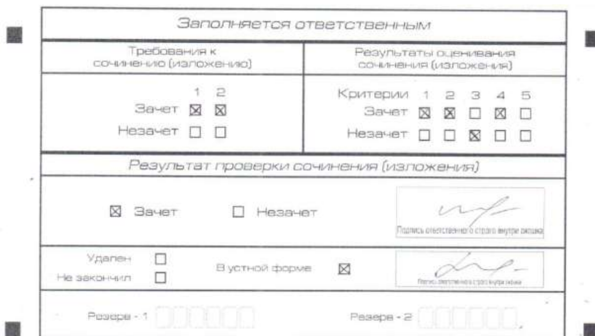
Рис. 9. Область для оценки работы сочинения (изложения) в устной форме

После окончания заполнения бланка регистрации ответственное лицо ставит свою подпись в специально отведенном для этого поле.